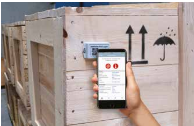
Unbestechlicher Beobachter auf der langen Reise stoßempfindlicher Produkte.